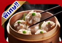
เกี้ยวซีอาน