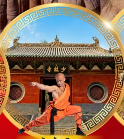
วัดเล่าหลิน