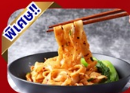
บะหมี่ Biang Biang