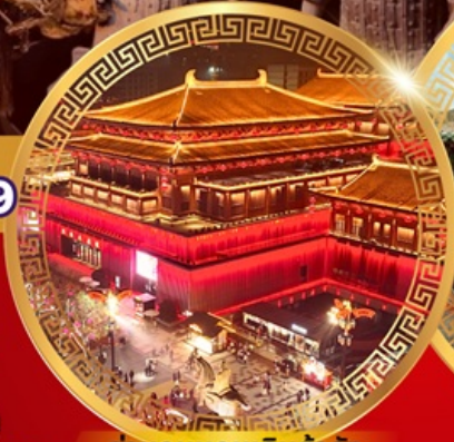
ย่านถนนคนเดินต้าถิง

วัดเล่าหลิน การแสดงโชว์กังฟู ป่าเจดีย์วัดเล่าหลิน ศาลเจ้ากวนอู ชมถ้ำผาหลงเหมิน จัตุรัสหอกลอง จัตุรัสหอรบะซัง ตลาดมุสลิม สุสานจีนซีอ่งเต๋ กำแพงเมืองซีอาน ชมเจดีย์ห่านป่าใหญ่ ย่านถนนคนเดินต้าถิง