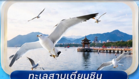
ทะเลสาบเตียนซิน