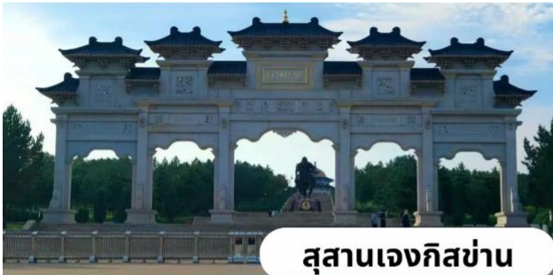
สุสานเจงกิสข่าน

นำท่านสู่ สุสานเจงกิสข่าน(ชมด้านนอก) สถานที่แห่งความศักดิ์สิทธิ์และเป็นที่เคารพสักการะของชาวมองโกล ปัจจุบันได้รับการบูรณะ ประกอบด้วยพระตำหนักหลักสามหลัง สร้างขึ้นในรูปแบบสถาปัตยกรรมมองโกล รูปร่างคล้ายกระโจมขนาดใหญ่ อาคารเชื่อมต่อกันด้วยระเบียงทางเดิน ภายในประดิษฐานพระบรมรูปของเจงกิสข่านสูง 5 เมตร ทรงเครื่องรบเต็มยศอย่างองอาจกล้าหาญสง่างาม ด้านหลังเป็นภาพแผนที่ "สี่อาณาจักรข่าน" อันได้แก่ อาณาจักรข่านซาคาไท, อาณาจักรอิลข่าน, อาณาจักรโกลเดนฮอร์ด, และอาณาจักรหยวนของกุบไลข่าน พระตำหนักด้านหลังประดิษฐานหีบพระศพจำลองคลุมด้วยผ้าแพรสีเหลือง ซึ่งบรรจุสิ่งของส่วนพระองค์ (ไม่รวมค่าเข้าชมภายใน ราคาท่านละ 90 หยวน)