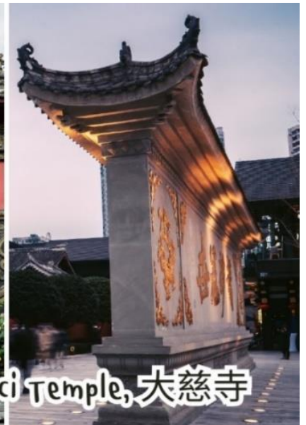
Daci Temple, 大慈寺