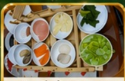
ขนมจีนข้ามสะพาน