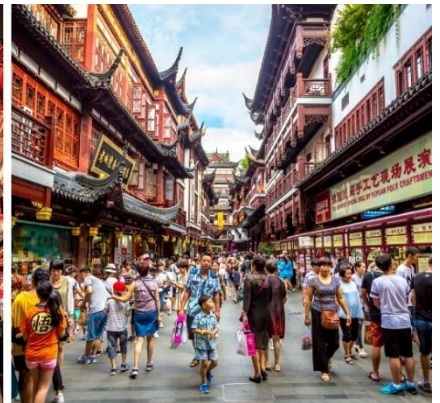
ตลาดเจียนหวังเมี่ยว หรือตลาดร้อยปี

จากนั้นนำท่านสู่ STARBUCKS RESERVE ROASTERY สาขาใหม่ที่นครเซี่ยงไฮ้ มาพร้อมกับความยิ่งใหญ่อลังการ ครอบครองตำแหน่งสตาร์บัคส์ที่ใหญ่และสวยที่สุดในโลก ซึ่งได้ทำการเปิดตัวไปเมื่อวันที่ 6 ธันวาคม 2560 มีเนื้อที่ใหญ่โตถึง 2,787 ตารางเมตร ด้านบนของร้านตกแต่งด้วยแผ่นไม้รูปหกเหลี่ยมซึ่งเป็นงานแฮนด์เมดจำนวน 10,000 แผ่น และที่ตั้งตระหง่านอยู่กลางร้านคือถังคั่วกาแฟทองเหลืองขนาด 40 ตัน สูงเท่าตึก 2 ชั้น ประดับประดาด้วยแผ่นตราประทับแบบจีนโบราณมากกว่า 1,000 แผ่น ซึ่งบอกเล่าเรื่องราวความเป็นมาของสตาร์บัคส์ กาแฟที่คั่วในถังทองเหลืองนี้จะถูกส่งผ่านไปตามท่อทองเหลืองด้านบน ซึ่งจะทำให้เกิดเสียงรบกวนกับเสียงดนตรี มีเคาน์เตอร์ที่ยาวที่สุด ซึ่งมีความยาวถึง 26.9 เมตร