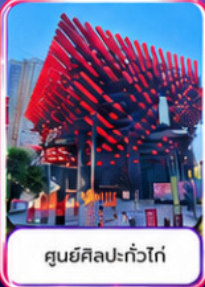
ศูนย์ศิลปะแก้วโก