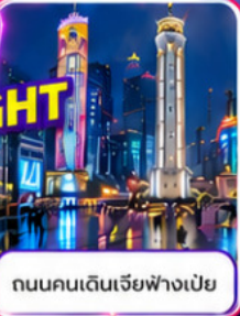
ถนนคนเดินเจียงฟางเป่ย์