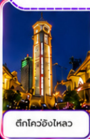
ตึกโควอชิงไหลว