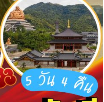
ภูเขาเสวียโต้วซาน