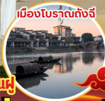
เมืองโบราณถังฉี