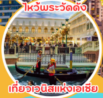
เที่ยวเวนิสแห่งเอเชีย