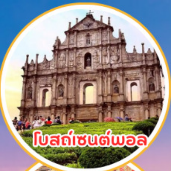
โบสถ์เซนต์พอล