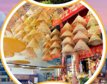
ไหว้พระวัดตั้ง