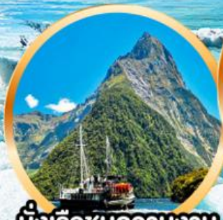
นั่งเรือชมความงาม พยอร์ดแห่ง มิลฟอร์ด ซาวด์