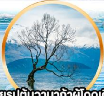
ถ่ายรูปต้นวานากาผู้โดดเดี่ยว ที่ทะเลสาบวานากา