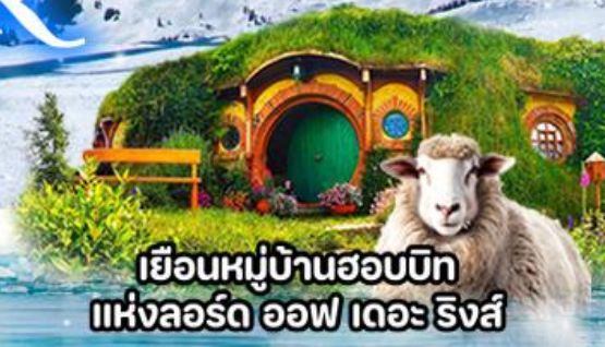
เยือนหมู่บ้านฮอบบิท แห่งลอร์ด ออฟ เดอะ ริงส์