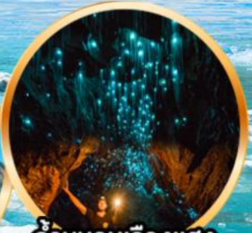
ถ้านอนเรื่องแสง ไวท์ไทม์

10 D | 22-31 ก.ค. 69 (วันเฉลิมฯ, อาสาพหุวิชา, เข้าพรรษา) 8 N | 08-17 ส.ค. 69 (วันแม่แห่งชาติ)