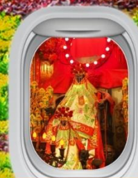
เจ้าแม่กวนอิมสองอ่ำ