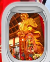
วัดฯขงหมิว