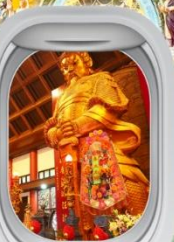
วัดฯชางหมิว