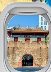
เมืองโบราณหนาวโกว