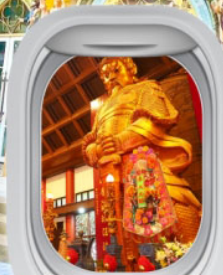
วัดเข่งเหมียว