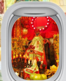
วัดเจ้าแม่กวนอิมสองฮา