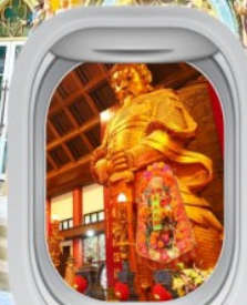
วัดเข่งหนิว