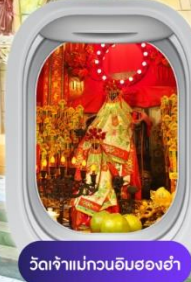
วัดจำเนกอนอิมองอ่า