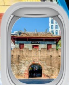
เมืองโบราณหนาวโก