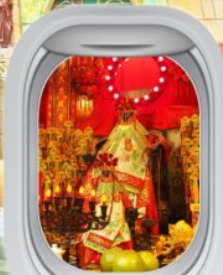
วัดเจ้าแม่กวนอิมสองฮา