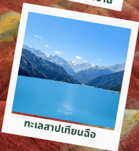
ทะเลสาปเทียนฉือ