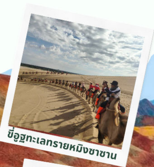
ขี่อูฐทะเลทรายหมิงซาซาน