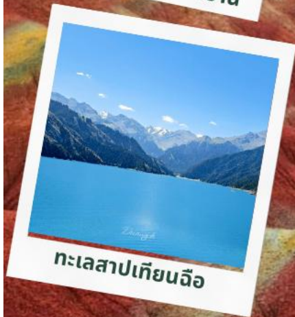
ทะเลสาปเทียนฉือ