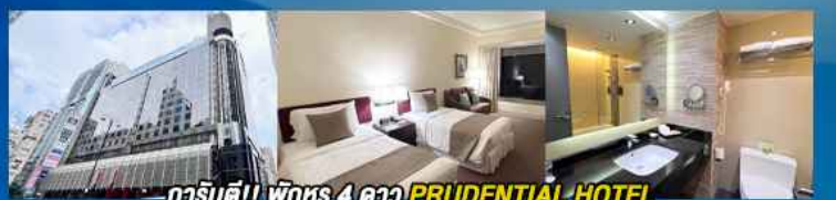
гаринดี!! พักหรู 4 ดาว PRUDENTIAL HOTEL ติดถนนนาธาน ย่านช้อปปิ้งจิมซาจуй