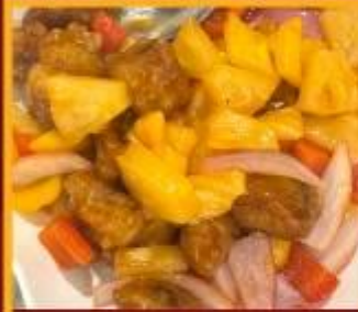
กระดุกหมูผัดเปรี้ยวหวาน