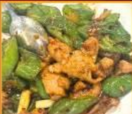
หมูผัดพริกหยวก