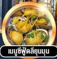
เมนูซีฟู้ดสลีสแบบ