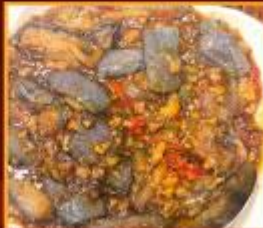
มะเขืออบหม้อดิน