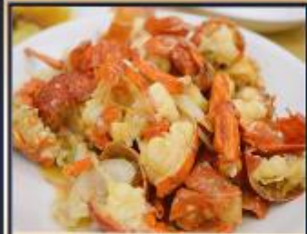
กุ้งมังกรอบซีส