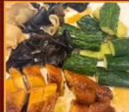
ไก่ แดงกวา เห็ดหูหนู