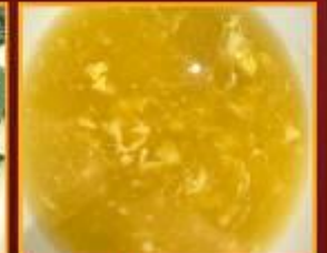
ซุ๊ปข้าวโพด