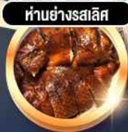
ห่านย่างสลีส