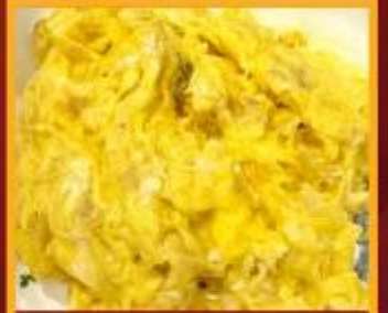
ไข่เจียวทรงเครื่อง