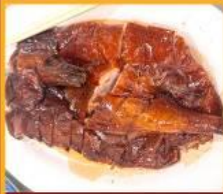
ท่านอย่าง