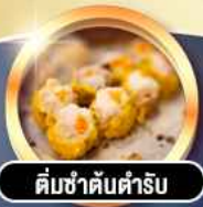
ติ่มซำคั่นตำรับ

гаринди! พักหรู 4 ดาว THE KOWLOON HOTEL ติดถนนนาธาน ย่านช้อปปิ้งจิมซาจอย