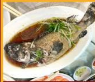
ปลาหนึ่งซีอิ้ว