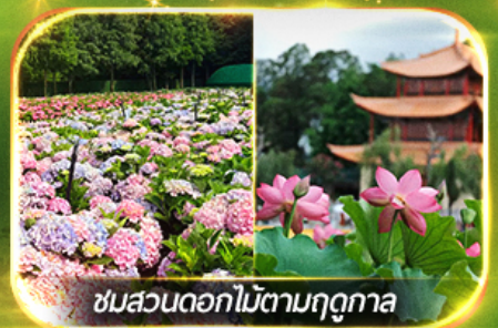
ชมสวนดอกไม้ตามฤดูกาล

นั่งกระเช้าภูเขาหิมะเจียวจื่อ ชมน้ำตกสุดอลังการสวนน้ำตกคุนหมิง ช้อปปิ้งถนนคนเดินหนานผิงเจีย, ชมดอกไม้ตามฤดูกาล