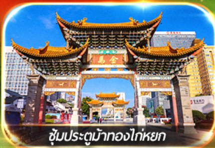
ซุ้มประตูม้าทองไถ่หยก