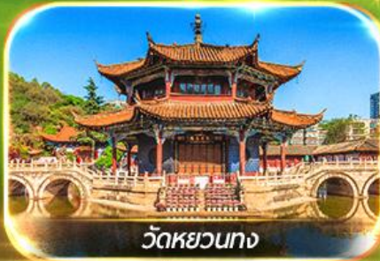
วัดหยวนทาง