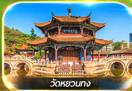
วัดหยวนตง