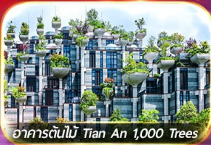
อาคารต้นไม้ Tian An 1,000 Trees