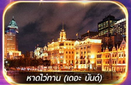
หาดวอทาน (เดอะ บันด์)

เที่ยวดิสนีย์แลนด์เต็มวัน (รวมรถรับ-ส่ง)