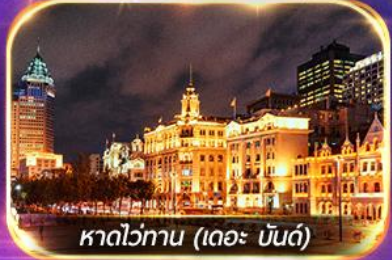
หาดวอทาน (เดอะ บันด์)

เที่ยวดิสนีย์แลนด์เต็มวัน (รวมรถรับ-ส่ง)