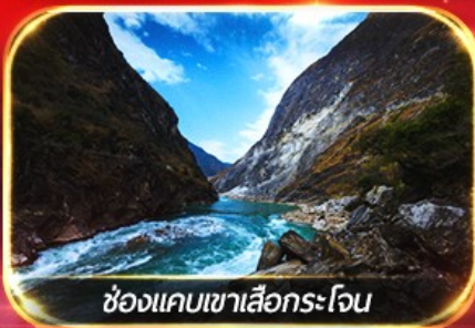
ช่องแคบเขาเสือกระโจน