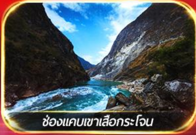
ช่องแคบเขาเสือกระโจน