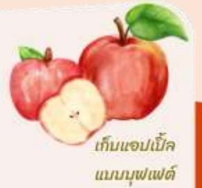
เก็บแอปเปิ้ล แบบบุฟเฟ่ต์