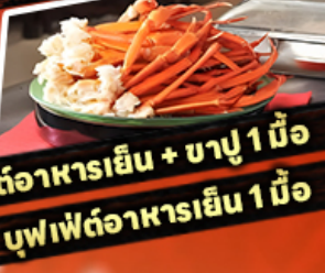
บุฟเฟ่ต์อาหารเย็น + ชาปู 1 มื้อ บุฟเฟ่ต์อาหารเย็น 1 มื้อ