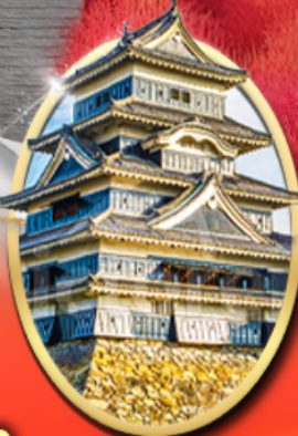
ปราสาทมัตสึโมโด้

รหัสทัวร์ RJ-VZNR004 เดินทาง 5D 3N ท.ย. - ต.ค. 69