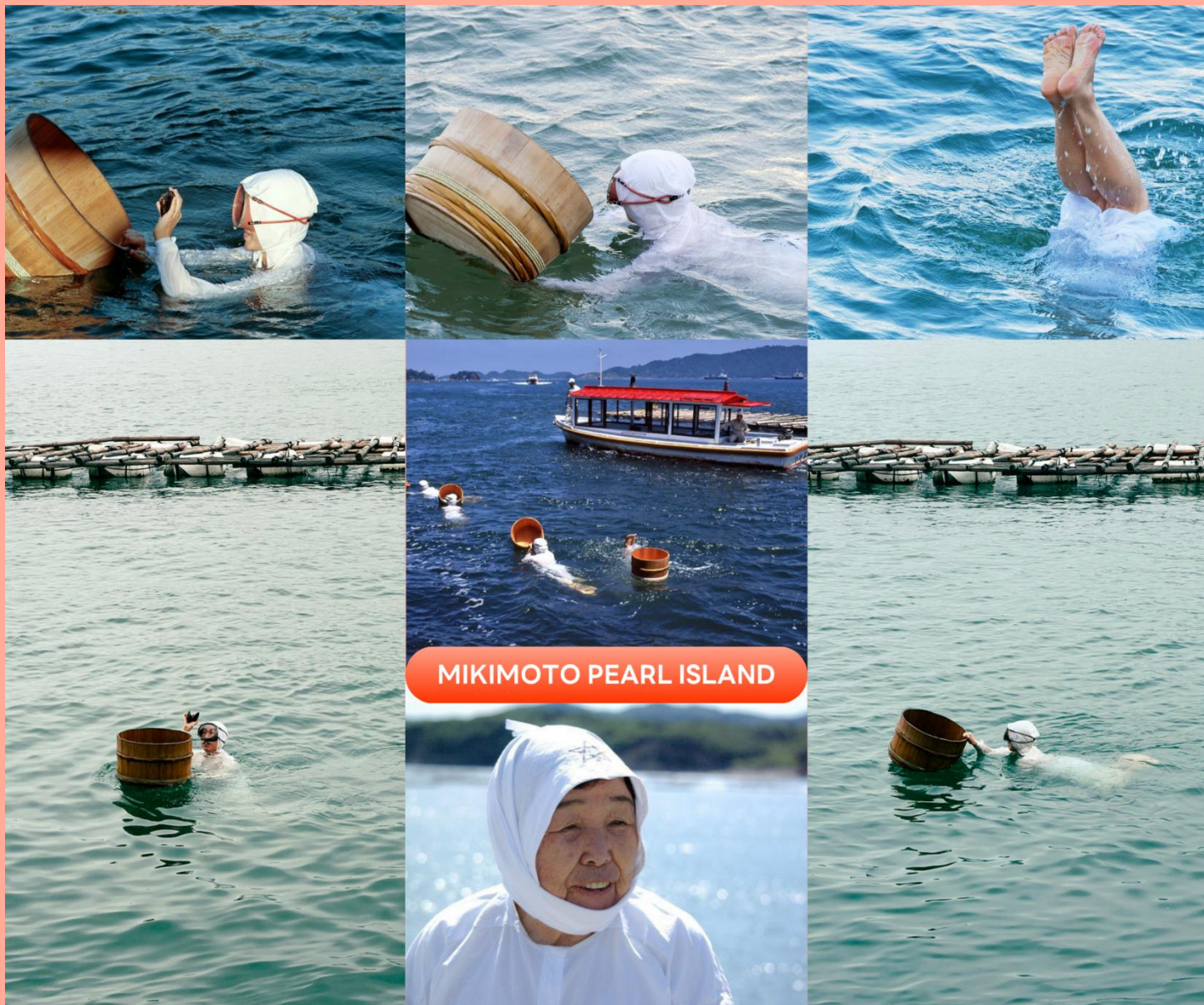
MIKIMOTO PEARL ISLAND

จากนั้นนำท่านเดินทางไปยัง เมืองอิเสะ (Ise) เป็นศูนย์กลางทางจิตวิญญาณที่ศักดิ์สิทธิ์ที่สุดของญี่ปุ่น บรรยากาศเมืองเต็มไปด้วยกลิ่นอายประวัติศาสตร์ โดยเฉพาะย่านเมืองเก่า และร้านค้าดั้งเดิม เพื่อนำท่าน ชมโชว์ดำน้ำอามะซัง ที่เกาะไข่มุก Mikimoto Pearl Island โดยผู้หญิงที่ดำน้ำลงไปทะเลโดยไม่ใช้อุปกรณ์ดำน้ำใด ๆ คือ อามะซัง (Ama san) ทุกท่านจะได้ทั้งความรู้ ความสนุก รับรู้ถึงจิตวิญญาณของท้องทะเล ใช้เวลาเดินทางประมาณ 1 ชั่วโมง