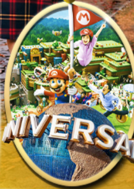
อิสระเลือกซื้อบัตร Universal Studios Japan

ไอโคโน พิคเช! บุฟเฟต์บิงย่าง 1 มื้อ อิสระท่องเที่ยว 1 วันเต็ม