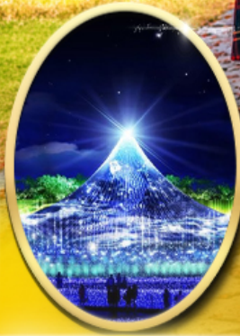
Nabana No Sato