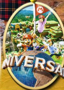
อิสระเลือกซื้อบัตร Universal Studios Japan