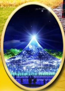
Nabana No Sato