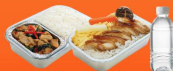
บริการอาหารร้อนบนเครื่อง ขาไป - ขากลับ