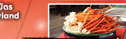
บุฟเฟ่ต์อาหารเย็น + ชาปู 1 มื้อ

Air Asia บินตรง นาริตะ เครื่องลำใหญ่ 370 ที่นั่ง