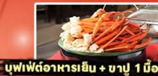
บุฟเฟ่ต์อาหารเย็น + ชาปู 1 มื้อ

รหัสทัวร์ RJ-XJ134 เดินทาง 5D 3N ก.ย. - ต.ค. 2569