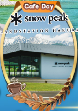
Snow Peak Land Hakuba