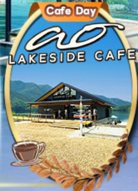
Ao Lakeside Cafe