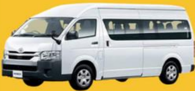
VAN (2-8 ท่าน)