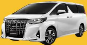
Alphard (2-4 ท่าน)