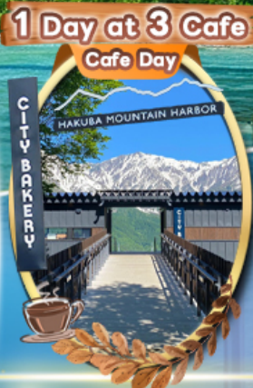
The City Bakery