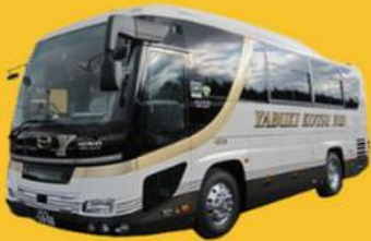
Bus (10-20 ท่าน)

➔ สำหรับท่านที่ต้องการความเป็นส่วนตัวมากขึ้น ท่านสามารถเลือกใช้บริการ รถส่วนตัวได้โดยมีรูปแบบรถให้เลือกถึง 3 ประเภท โดยรถ แต่ละประเภทสามารถนั่งได้ตั้งแต่ 2 ท่านขึ้นไป