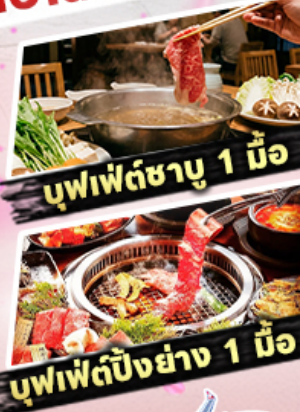
บุฟเฟ่ต์ชาบู 1 มื้อ