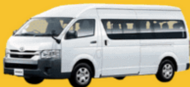
VAN (2-8 ท่าน)