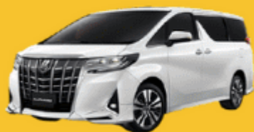
Alphard (2-4 ท่าน)