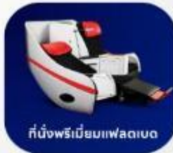
ที่นั่งพรีเมียมฟเลกซ์