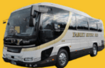
Bus (10-20 ท่าน)

➔ สำหรับท่านที่ต้องการความเป็นส่วนตัวมากขึ้น ท่านสามารถเลือกใช้บริการ รถส่วนตัวได้โดยมีรูปแบบรถให้เลือกถึง 3 ประเภท โดยรถ แต่ละประเภทสามารถนั่งได้ตั้งแต่ 2 ท่านขึ้นไป