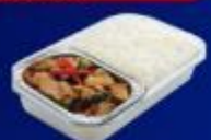
ข้าวกะเพราไก่