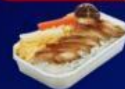
ข้าวหน้าไก่ย่างเกาหลี

บริการอาหารร้อน และ น้ำดื่ม บนเครื่อง ขาไป และ ขากลับ