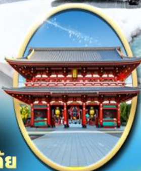
วัด เซ็นโซจิ

ถนนนากาบิสะ ซอยบิจิ ตลาดอะบิโยโกะ ตลาดเช้า ฝ้ายทอ ถนนซันมาจิซุกุ สะพานนากาบาชิ