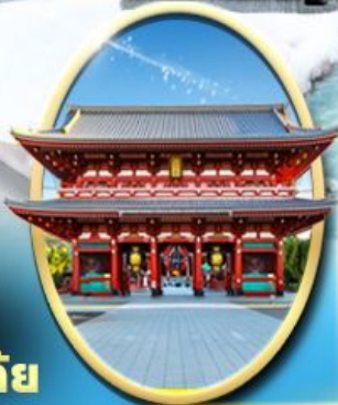
วัด เซ็นโซจิ