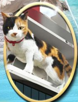
ซอยบิจิ ซินจุกุ