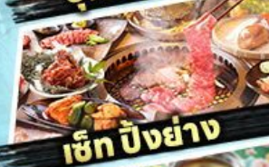
เซ็ท ปิงย่าง