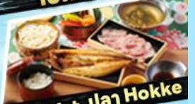
เอ๊กซาซุ + ปลา Hokke

36,919 ราคา เริ่มต้น บาท รวมภาษีมูลค่าเพิ่ม 7%