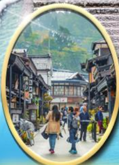
เมืองเก่า ทาคายาม่า