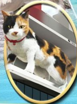
ซัปโปง ชินจูกุ