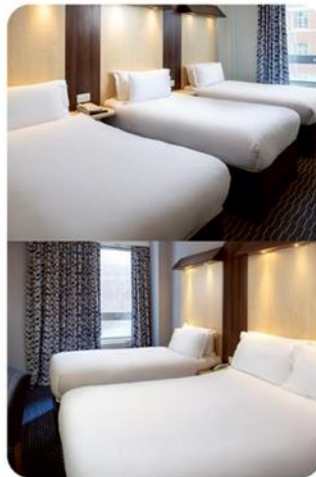
ห้องพัก สำหรับ 3 ท่าน TRIPLE ROOM (TRP)

กรณีห้อง Twin Bed ของทางโรงแรมไม่มีหรือเต็ม ทางบริษัทขอปรับเป็นห้อง Double Bed แทน หรือ หากต้องการห้องพักแบบ Double Bed ของทางโรงแรมไม่มีหรือเต็ม ทางบริษัทขอปรับเป็นห้อง Twin Bed แทน และหากต้องการพักแบบ Triple Room ของทางเราไม่มีหรือเต็ม ทางบริษัทขอปรับเป็นห้อง 1 เตียงใหญ่ (Queen Size) + 1 เตียงเล็กแทน โดยมีต้องแจ้งให้ทราบล่วงหน้า