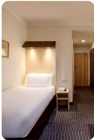
ห้องพัก สำหรับ 1 ท่าน SINGLE ROOM (SGL)