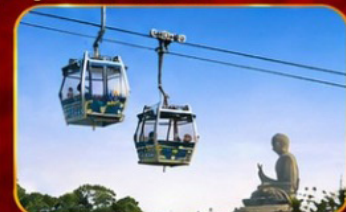
กระเช้านองปิง