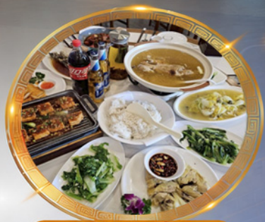
โต๊ะจีนลองซิ่ง เมนูต้นตำรับ รสจัดจ้านแท้ๆ