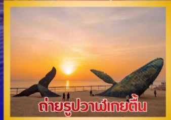
ต่ายรูปวาฬยักษ์ตื่น