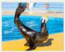
POLAR OCEAN PARK