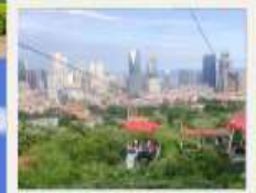
กระเช้าชมเมือง