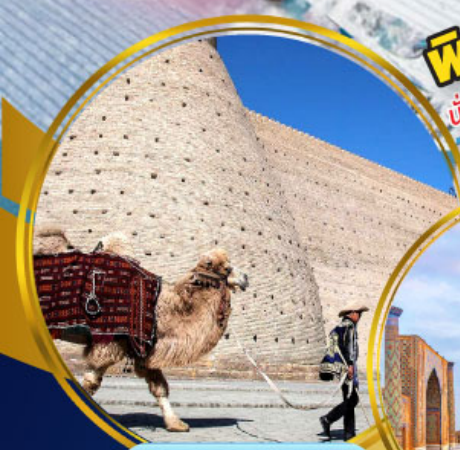
บ้อมปรากรบูการ์่า