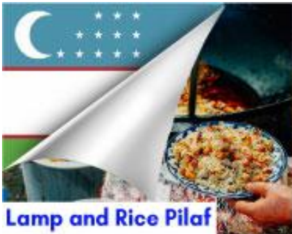
Lamp and Rice Pilaf