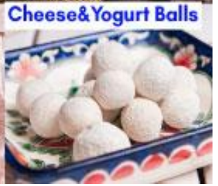
Cheese & Yogurt Balls