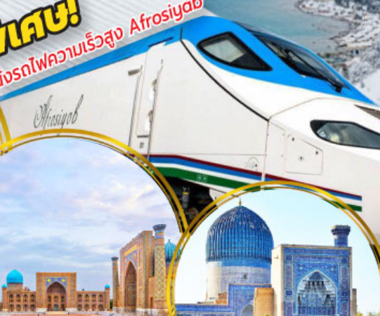
จัตุรัสเรจิสถาน