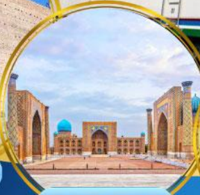
จัตุรัสเรจิสถาน