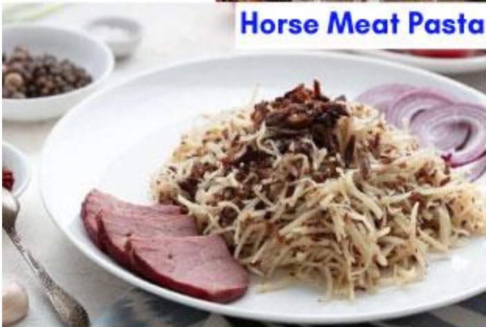
Horse Meat Pasta