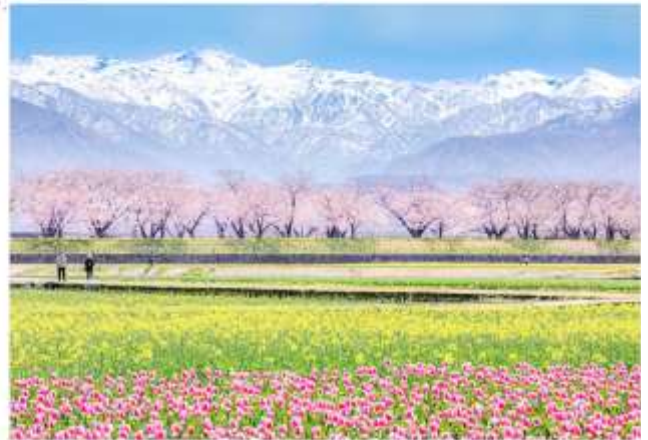
ASAHI FUNAGAWA RIVER