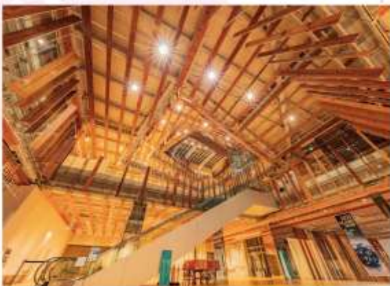
TOYAMA GLASS ART MUSEUM

ตื่นตากับ “สวนศิลปะแก้ว” สีสันสดใสผลงานระดับโลก พร้อมเพลิดเพลินไปกับมุมมองรูปสวยๆ ห้องสมุดสุดชิค และคาเฟ่บรรยากาศดีที่ร่วมไว้ในที่เดียว