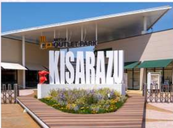
SHOPPING AT MITSUI OUTLET PARK KISARAZU

อิสระอาหารค่ำตามอัธยาศัย (ไม่รวมในรายการ)