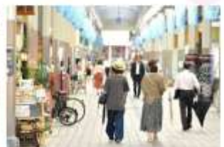
SHOPPING AT SOGAWA DORI STREET