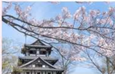
TAKADA CASTLE SITE PARK