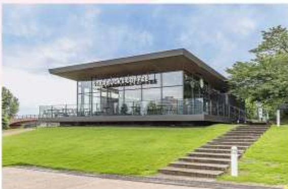
STARBUCKS KANSUI PARK

ดื่มด่ำชมวิวชิลล์ๆ ที่ร้าน “STARBUCKS KANSUI PARK” ที่ได้คำชมว่าสวยที่สุดในญี่ปุ่น ด้วยดีไซน์สวยทันสมัย ตั้งอยู่ริมคลองฟูกับที่บอบกศมนียภาพริมน้ำ และสะพานเก็นมอนผ่านกระโจมขนาดใหญ่เหมาะสำหรับ การพักผ่อนอย่างสงบ (บริการเครื่องดื่มท่านละ 1 แก้ว)