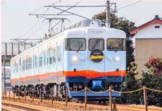
TAKE TRAIN 13000 FEET

ภายในตกแต่งด้วยไม้ซิดาร์ “อีบี ซาโตยามะ” ผลิตจากไม้สนน้ำเงินที่สะท้อนความงามของอ่าวโกยามา เป็นการออกแบบที่สะท้อนถึงประวัติศาสตร์และมรดกของรถไฟซีรีส์ 413 ของการรถไฟแห่งชาติญี่ปุ่นในอดีต สัมผัสซูชิหน้าพลาสติก ส่งตรงจากอ่าวโกยามา แหล่งรวมวัตถุดิบชั้นเลิศที่จับซื้อผ่านคลายไปกับทัศนียภาพอันงดงามผ่านหน้าต่างรถไฟ ที่ช่วยเพิ่มอรรถรสให้มื้ออาหารของท่านประทับใจยิ่งขึ้น