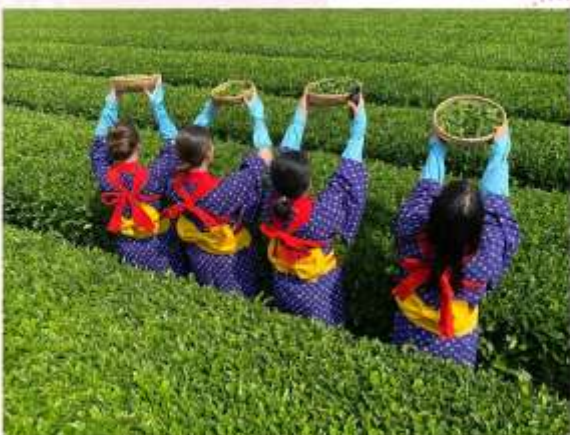
BLEND TEA EXPERIENCE AT MIYAMANOEN

รับประทานอาหารค่ำตามอริยาซึย (รับเงินคืนท่านละ 3,000 เยน)