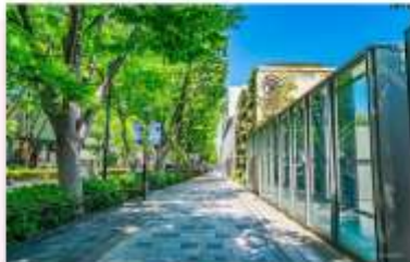
SHOPPING AT OMOTESANDO STREET