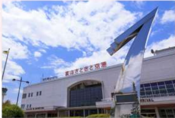
FLY TO TOYAMA AIRPORT