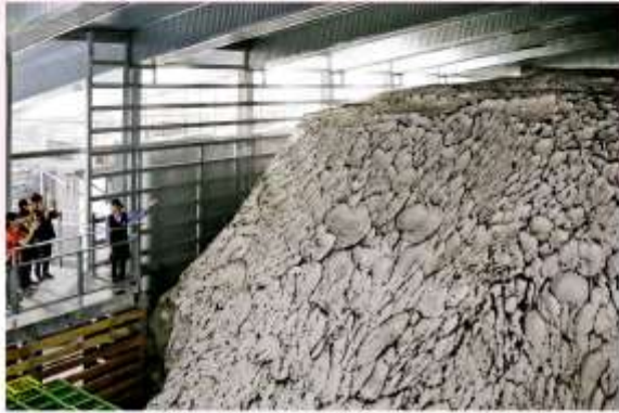
UONUMA NO SATO