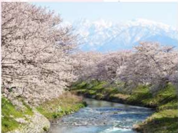
ASAHI FUNAGAWA RIVER

ชมซิมบมดเด่นแห่งอุโมงค์ชาภูระกว่า 280 ต้น ที่บานสะพรั่งเป็นทิวแถวยาวกว่า 600 เมตร เสียบไปกับสายน้ำใสสะอาด สัมผัสบรรยากาศสุดโรแมนติกของทิวชาภูระที่ร่วงหล่นสะท้อนเงาบนผิวน้ำ ตัดกับยอดเขาแอลป์ที่หาชมได้ยากเพียงช่วงเดียวของปี