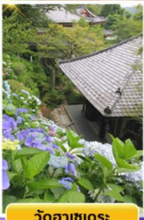
วัดฮาเซเดระ