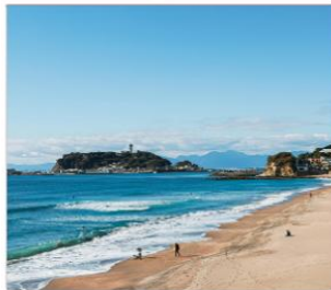
เกาะเอโนชิมะ