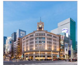
กินซ่า ช้อปปิ้ง