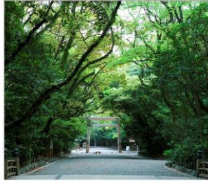
ศาลเจ้าอัสึตะ