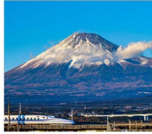
นั่งชินคันเซนชมฟูจิ