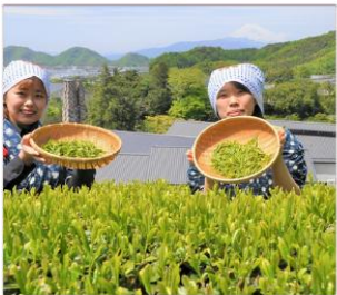
กิจกรรมเก็บชา