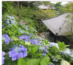
วัดฮาเซเดระ(เดรนเยีย)