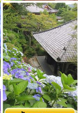
วัดฮาเซเดระ