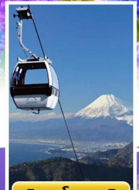
อีซูพานรามาวิว