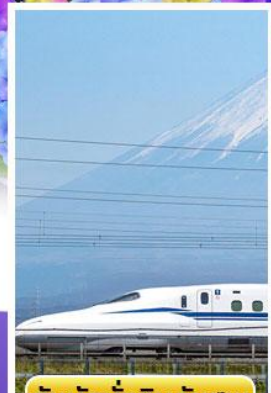
สัมผัสนั่งชินคันเซน