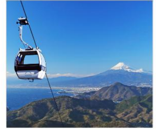
ชิบุพานิรามาริว