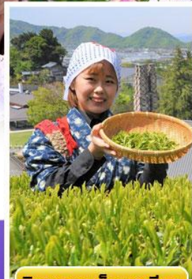
กิจกรรมเก็บชาเขียว