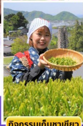
กิจกรรมเก็บชาเขียว