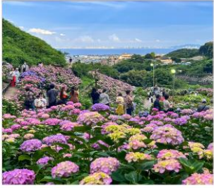
เทศกาลดอกไฮเดรนเยีย