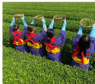
กิจกรรมเก็บชาみやโนเอ็น