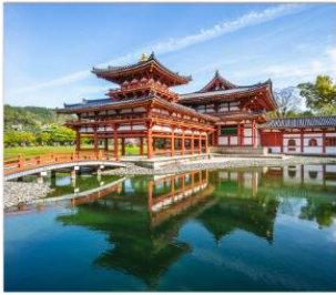
วัดเนียวโตอินและ ถนนซาเงียว