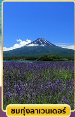
ชมทุ่งลาเวนเดอร์