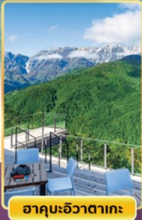
ฮาคุบะฮิวาตากะ