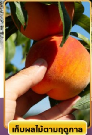
เก็บผลไม้ตามฤดูกาล