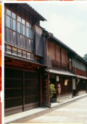
ย่านอิงาชิบายะ