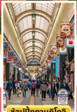
ช้อปปิ้งทานุกิโคจิ