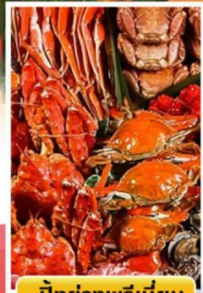
ปิ้งย่างพรีเมียม

🍷 ออนเซ็น 2 คั้น 🧳 นน.กระเป๋า 23 กก. ☀️ 6Days 4Night