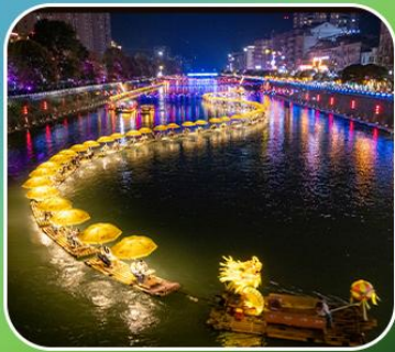
"ล่องเรือมังกรกังซู่"

เที่ยวจีน 2 มณฑล เสฉวน+หูเป่ย์ (เมืองฉงชิ่ง+เมืองเอ็นฉือ) • ต้าเถิงหลง ล่องเรือมังกรกังซู่ชมวิวยามค่ำคืน • ผิงซานแกรนด์แคนยอน (รวมล่องเรือ) หงหยาดัง • วัดหลิวอัน • ถนนคนเดินเจียฟางเป่ย์ • ตึกตะเกียบ