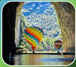
"ต้าเถิงหลง"