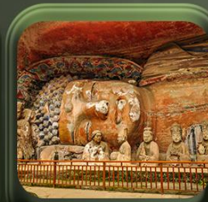
“ ผาหินแกะสลักต้าจู้ ”