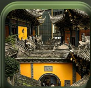
“ วัดหลัวอัน ”