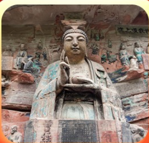
“ผาหินแกะสลักต้าจู้”