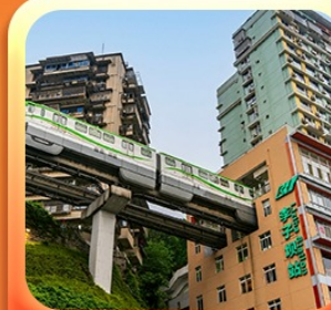
“นั่งรถไฟทะลุตึก”