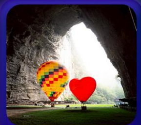
“ ถ้าเถิงหลง ”