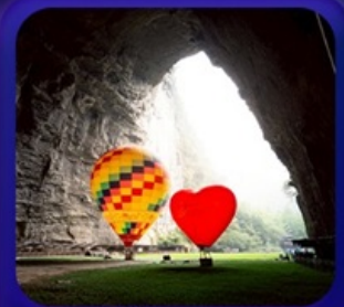
“ ถ้ำเกิ่งหลง ”