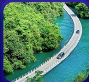
“ หุบเขาสิงโต ซื่อจื่อกวน ”