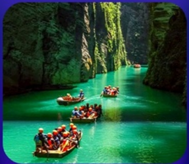
“ ผิงซานแกรนด์แคนยอน ”

เที่ยวจีน 2 มณฑล เสวอน+หูเป่ย์ • ถ้ำเกิ่งหลง • หุบเขาสิงโต ซื่อจื่อกวน ล่องเรือมังกรกังซู่ยชมวิวยามค่ำคืน • ผิงซานแกรนด์แคนยอน (รวมล่องเรือ) หงหยาดัง • จุดชมรถไฟฟ้าทะลุคอก • ตึกตะเกียบ • สือปาตี้ • หลงเหมินฮ่าว