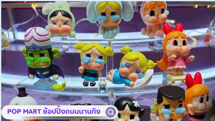
POP MART ช้อปปิงถนนนานจิง

มากมาย แต่ทุกอย่างกระจจัด กระจายอยู่ตามที่ต่างๆแบบต่างคนต่างอยู่ Tian An 1,000 Trees จึงเป็นเหมือนตัวกลางที่เชื่อมทุกอย่างให้เข้ากันทั้ง ตัวสถาปัตยกรรม ธรรมชาติ ศิลปะ และวิถีชีวิตผู้คนได้อย่างลงตัว นำท่านสู่บริเวณ หาดไวทาน (WAITAN) ซึ่งไม่ได้เป็นหาดทรายชายทะเลแต่อย่างใด แต่เป็นย่านถนนริมแม่น้ำที่มีความยาว 1.5 กิโลเมตร ไปตามริมแม่น้ำ หวงผู้ฝั่งตะวันตกซึ่งอยู่ในย่านเมืองเก่าหาดไวทานยังคงเป็นสถานที่ถ่ายทำภาพยนตร์ที่โด่งดังเรื่อง “เจ้าพ่อเซี่ยงไฮ้” จากนั้น อีสรระท่านเพลิตเพลินที่ ถนนนานจิง(NANJING ROAD) เป็นย่านช้อปปิ้งเก่าแก่ที่สุดของเซี่ยงไฮ้ เป็นตลาด ซื้อขายของกัน คึกคักตั้งแต่ทศวรรษ 1920 ตั้งอยู่ฝั่งผู้ซีกินพื้นที่ยาวตั้งแต่ฝั่งตะวันตกของ “เดอะ บันด์” ถึง “พีเพิลส์ สแควร์” เป็นแหล่งช้อปปิ้งสินค้าแบรนด์เนมจากทั่วโลก และยังเป็นศูนย์รวมร้านค้าและร้านอาหารอีกมากมาย และพลาดไม่ได้กับนักกลุ่มอาร์ททอยอย่างแบรนด์ POPMART GLOBAL FLAGSHIP STORE ร้านขายของเล่นที่เป็นที่โด่งดังในขณะนี้ไม่ว่าจะ LABUBU MOLLY SKULLPANDA และอย่างอื่นอีกมากมาย ให้ท่านได้เลือกลุ้นกันอย่างสนุกสนาน