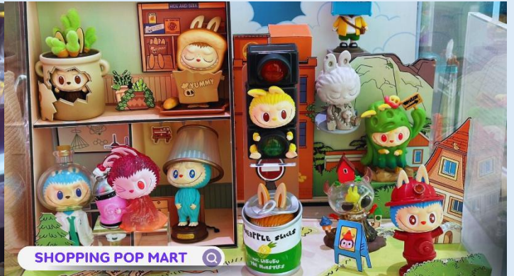
SHOPPING POP MART