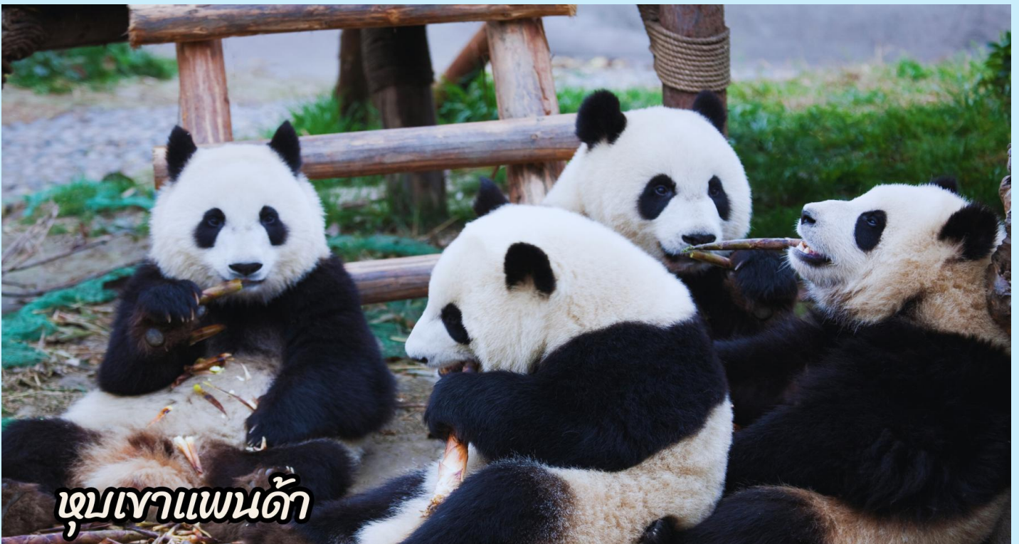
หุบเขาแพนด้า

จากนั้นนำท่านชม จัตุรัสหย่างเทียนหวู่ นำท่านถ่ายกับรูปปั้นผลงานศิลปะ รูปแพนด้าถ่ายเซลฟีที่ตั้งอยู่กลางจัตุรัส สุดน่ารัก ซึ่งออกแบบโดยนักออกแบบชื่อดัง FLORENTIJJN HOFMAN หมีแพนด้าตัวนี้มีความยาว 26 เมตร กว้าง 11 เมตร สูง 12 เมตรและหนัก 130 ตัน อยู่ในท่านอนหงายบนพื้นเท้ายกขึ้นจับไม้เซลฟีสีชมพูเล่นถ่ายเซลฟีอย่างสบายอารมณ์ น่ารักน่าเอ็นดูมาก นักออกแบบ Hofman แนะนำว่าผลงานแพนด้ายักษ์โทรศัพท์มือถือขึ้นเพื่อถ่ายเซลฟีที่มีความสนุกสนาน ด้วยท่าทางสบาย ๆ ผ่อนคลายและมีความสุข และเป็นการแสดงออกด้วยภาษาทางศิลปะแบบหนึ่งที่สะท้อนชีวิตในท้องถิ่น มอบความรู้สึกสนิทสนมและมีความสุขกับผู้ชมทุกท่าน นำท่านชม ร้านหนังสือจู่เก้อ โดดเด่นด้วยบันได ไม้ที่ตีไซเบอร์กล่าวว่าเป็นบันไดสู่สวรรค์หนังสือที่ดูศักดิ์สิทธิ์และน่าพิศวง และชั้นวางหนังสือมีรูปทรงจากแรงบันดาลใจของโคมไฟ ร้านหนังสือ สุดคูล บนชั้นของห้างสรรพสินค้า RéelMall ในย่านจิ้งอันกลางมหานครเซี่ยงไฮ้ สาธารณรัฐประชาชนจีน ออกแบบโดยสตูดิโอออกแบบ เพื่อเติมเต็มความสุขให้ลูกค้าผู้รักการอ่านหนังสือ ภายใต้คอนเซ็ปต์พื้นที่แห่งความสงบเงียบ พร้อมสเปซชวนผ่อนคลาย ตกต่าง