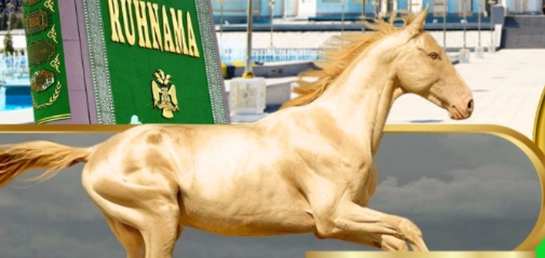
Akhal Teke Horse