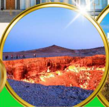
Darvaza Gate To Hell