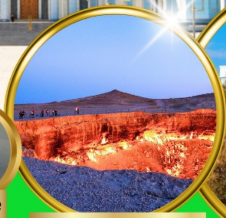
Darvaza Gate To Hell