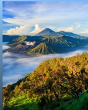
KING KONG HILL