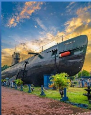
อนุสรณ์สถานเรือดำน้ำ