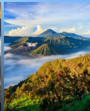
KING KONG HILL