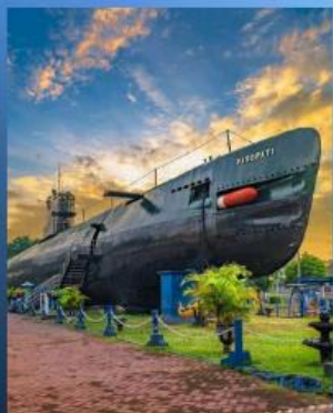
อนุสรณ์สถานเรือดำน้ำ