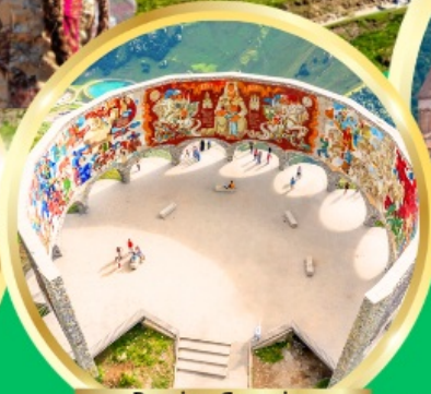
Russian-Georgian Friendship Monument