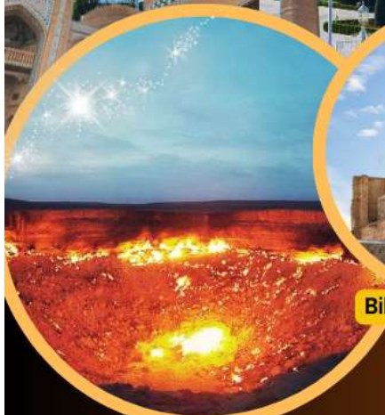
Darvasa "Door to Hell"

The Presidential Palace – Ertogrul Ghazi Mosque ดาร์วาซา – Kunya Ark Fortress – Kalta Minor Minaret มัสยิดคูมา - พระราชวังทัชคอบลี - Bibi Khanum Mosque พิพิธภัณฑ์โบราณวัตถุแห่งชาติ – องค์พระพุทธรูปปางนิพพาน เริ่มต้น จัตุรัสอามีร์ ตีมูร์ – Memorial Square