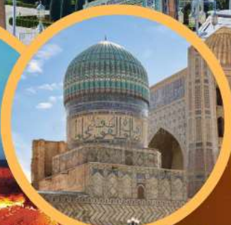
Bibi Khanum Mosque